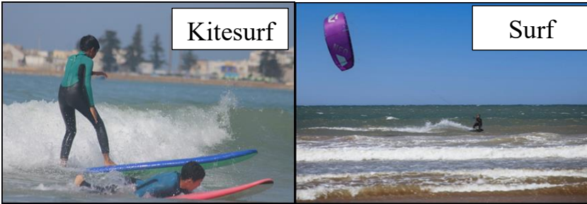
أنواع الرياضات البحرية بشواطئ الصويرة

هذه السياسة التنموية في مجال الحكامة الترابية، ستزيد لا محالة من الحاجة إلى أن تكون الصويرة ذات جاذبية سياحية، لأنها ستعمل على تحسين نوعية الحياة داخل مجالها وسيسمح ذلك بتعزيز التنمية المحلية المرغوبة يكون لها انعكاس جديد يعتمد روح الابتكار والإبداع ومحاولة الابتعاد عن الكلاسيكية من حيث إدارة وتديير المدينة.