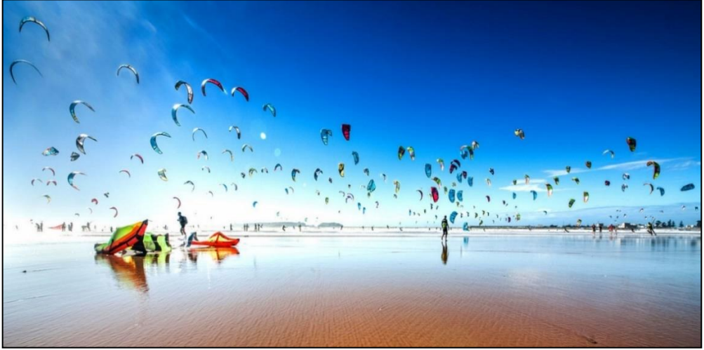
صورة تبين مشهد الرياضات البحرية بشاطئ مدينة الصويرة

البحرية بكل أصنافها التي تتكون من: الرُكْمَجَة Surf (ركوب الأمواج)، الألواح الطائرة، الألواح الشراعية ثم Wind surf أو Wingfoil التي ظهرت في سنة 2019. قد ساهم في إشعاع الرياضة البحرية بالمدينة تنظيم مجموعة من التظاهرات الوطنية والدولية في الرياضات المائية. فأول بطولة لركوب الأمواج بالإقليم كانت سنة 1997 بشاطئ سيدي كاوكي جنوب الصويرة واحتضنت الصويرة المرحلة الأولى لكأس العالم للترحلق الشراعي سنة 1998 وشاطئ بوزرقطون مال الصويرة من 2006 إلى 2010 حيث كل سنة يتم تنظيم هذا التظاهرة العالمية (وكالة المغرب العربي للأنباء، 2022). هذا بالإضافة إلى بطولة العالم للكييتسورف Kite surf بالصويرة سنة 2016 واحتضنت الصويرة كذلك النسخة الثانية لمهرجان المحيطات ما بين 12 و18 أبريل 2018.